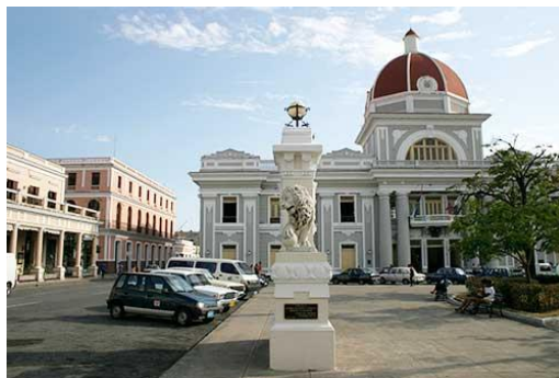
Palacio de Gobierno