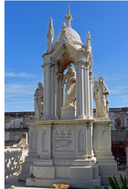
Grabmal aus Carrara Marmor